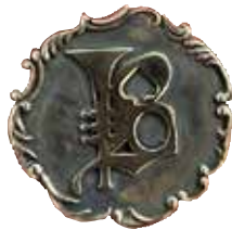
SILBERANSTECKER! Hochpolierter Silberanstecker exklusiv bei uns im Zelt! 29,- Euro